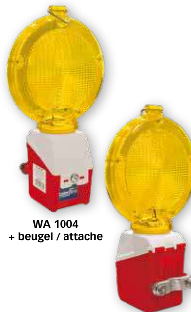
WA 1004 + beugel / attache