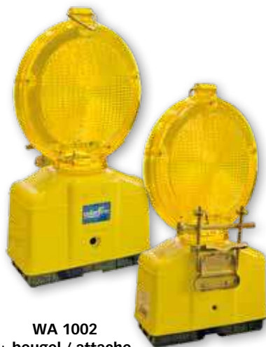
WA 1002 + beugel / attache